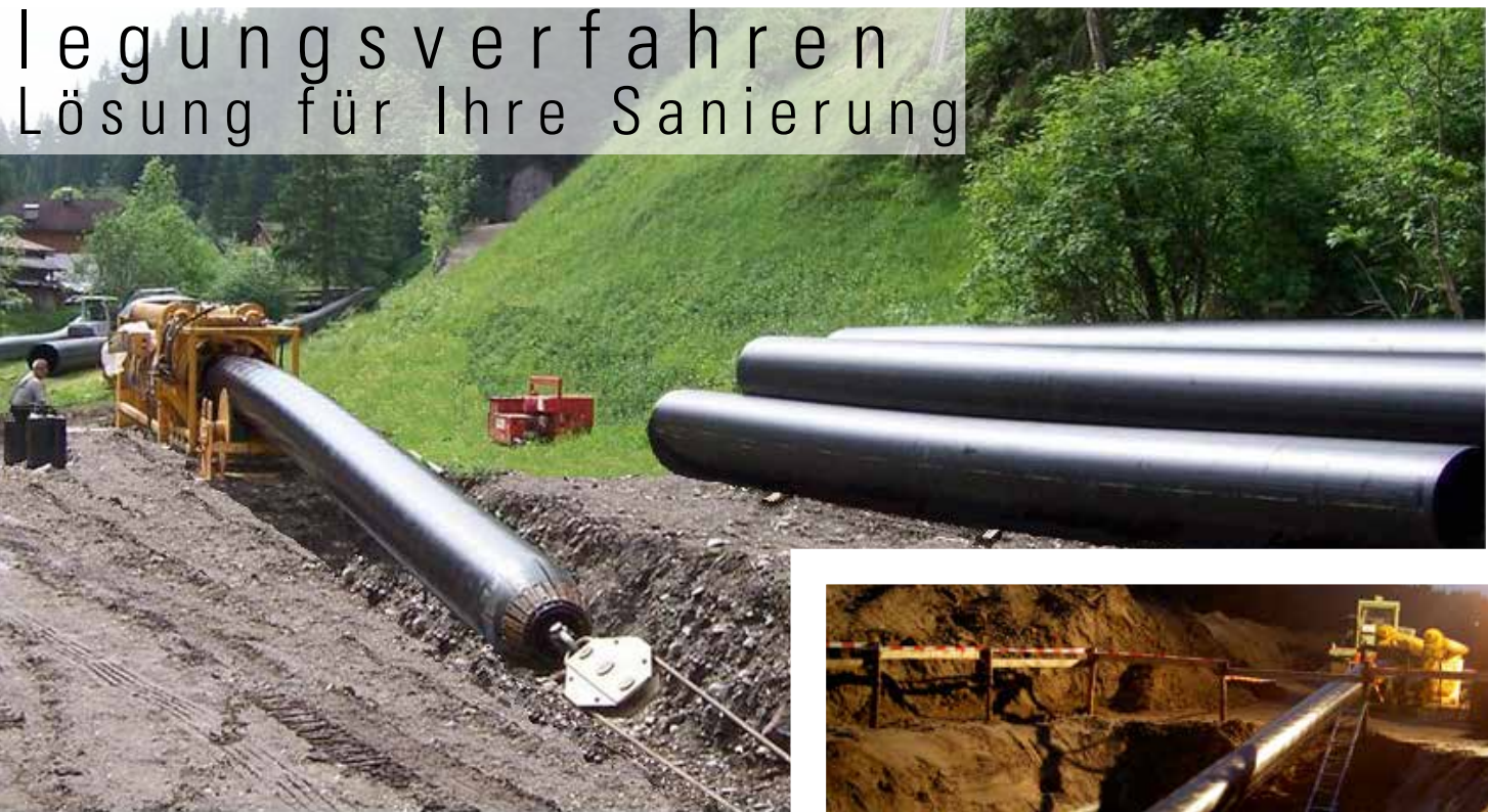
DynTec-Rig und Rohrstrang