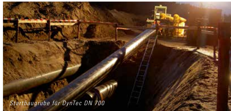
Startbaugrube für DynTec DN 700